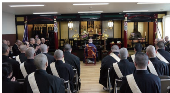
興隆学林校舎内御宝前

昭和に建築された学林の校舎は築四十年を迎え、阪神淡路大震災を経験、耐震強度に問題が生じたため耐震改築工事を行い、平成二十六年九月二十九日に平成の新校舎落成慶讃法要が