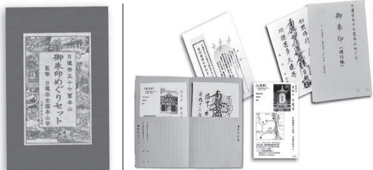
※セット内容イメージ

日蓮宗の本山五十七箇寺を巡り五十七紙の貫首さまの御首題に御朱印を拜受し巡る生涯忘れ得ぬ感動の旅を