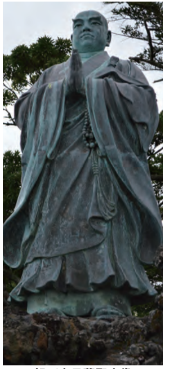
旭が森日蓮聖人像

の二回に集約し春には顕本法華宗総本山妙満寺において慶讃大法要、秋には日蓮大聖人ご生誕の地、安房小湊大本山誕生寺へ団体参拝による慶讃大法要を企画した。春は予定通りの慶讃大法要を厳粛に奉修されたが、二月末ごろより新型コロナウイルス感染症患者が増え、四月七日政府の緊急事態宣言発せられ、その後落ち着きをみせたものの収束をみず、六月十八日臨時理