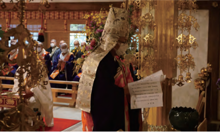
大川日仰猊下による表白文奉呈