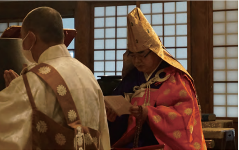
吉永京門理事長による先師靈簿読み上げ