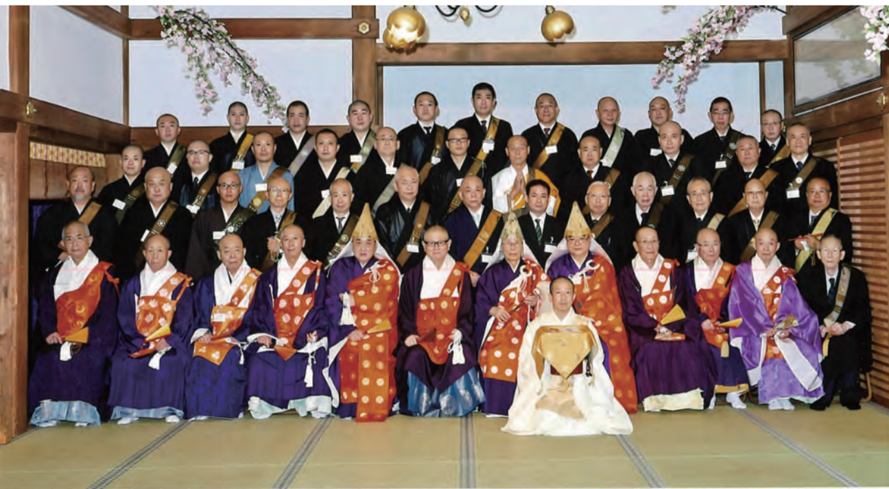
令和2年 日蓮聖人門下連合会「京都理事会」結成60周年記念法要 令和2年10月22日 於・顕本法華宗 総本山妙満寺