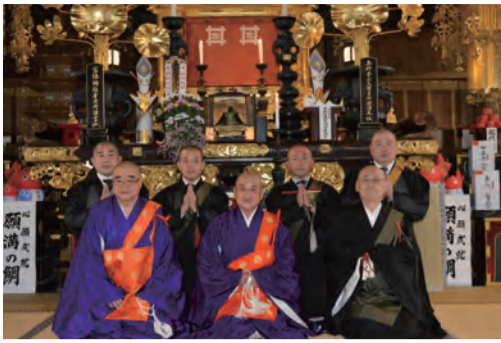
誕生寺祖師堂集合写真

京都門下連合会では日蓮聖人御降誕八〇〇年慶讃事業を御正当の前年として平成二十八年よりプロジェクトチーム編成し平成三十二年（令和二年）に向けて会議を重ね事業を企画立案してきた。例年の行事を春秋